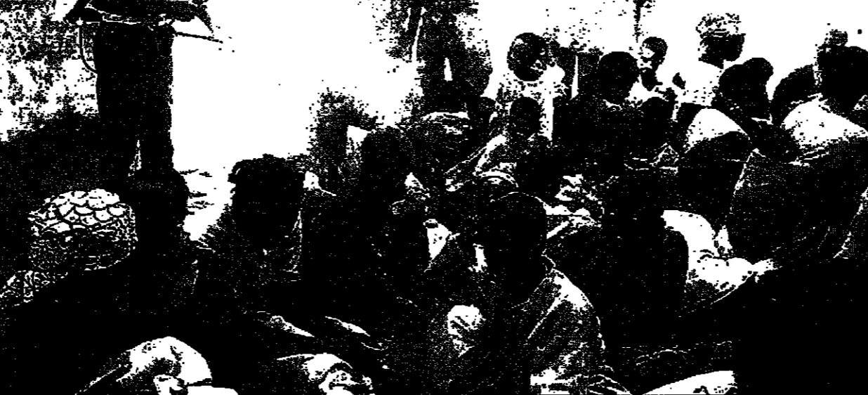
موظف وكالة مونايا بيرش لاجئين من البوتو بمطارات كيميائية تحسبا من انتشار الأوبئة في معسكر قرب كينشاسا (رويتز)

وعد رئيس الوزراء جون ميجر بمخ المدارس مزيدا من الاستقلالية وانشاء مدرسة ثانوية للمعوقين في كل